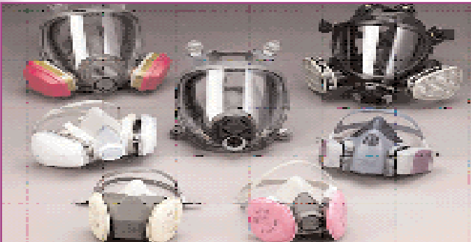
Şekil-5: Buhar ve toz filtreli solunum koruyucuları

boyaların uygulanması durumunda buhar ve toz tutabilen solunum koruyucuları kullanılmalıdır (Şekil-5). Bu tür solunum koruyucular sürekli kontrol altında tutulmalı filtrelerinin düzenli değiştirilmesi sağlanmalıdır.